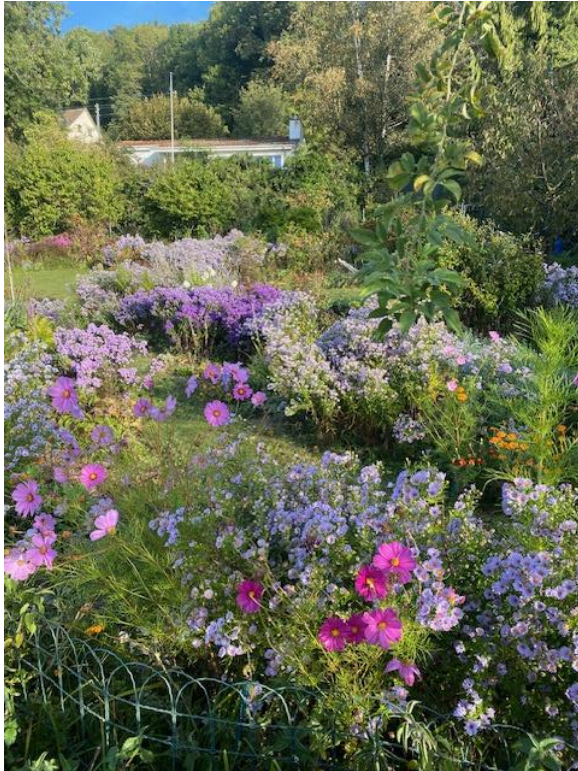
Bild: Der «Weihergarten» beim Domizil des Vereins, eine Freude für Passanten und Insekten