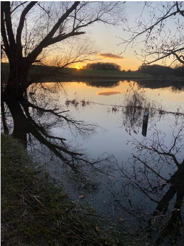
Bild: Blick im Dezember 2023 auf den Weiher, im Vordergrund sieht man, wie der Weiher über das Ostufer trat. Es waren auch die andern Uferseiten betroffen.