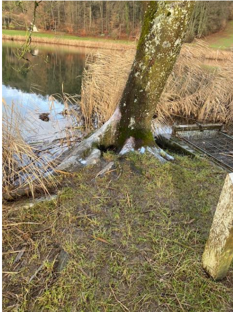
Bild: Biberbefall und Baumschutz beim Ausfluss