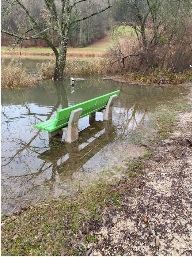
Bild: Überschwemmung beim Weiher Ost im Dezember 2023