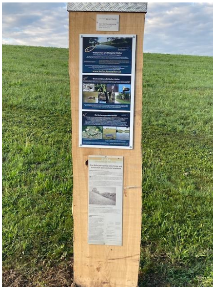
Bild: Holzsäule beim Weiher Südost

Für eine Orientierung der Bevölkerung und Besucher des Naturschutzgebiets wurden drei Holzsäulen mit ausführlichen Info-Tafeln beim Weiher Ost/Nordost/Südost eingerichtet. Diese fanden auch dieses Jahr reges Interesse für Besucher, die das erste Mal das Naherholungsgebiet aufsuchen.